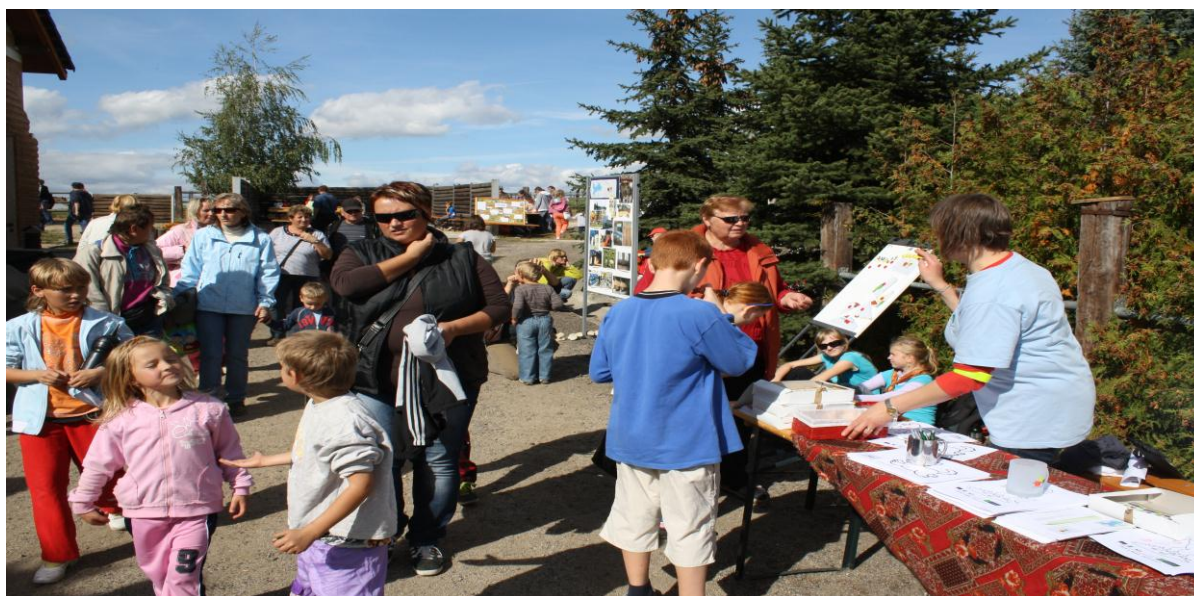
Obrázek 6: DEN s MAS