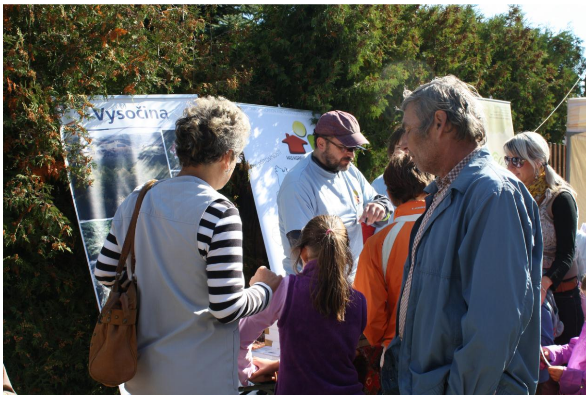
Obrázek 3: DEN s MAS 28.9.2012

Rozšíření Programového výboru MAS na 8 členů – hlášení změny leden 2013