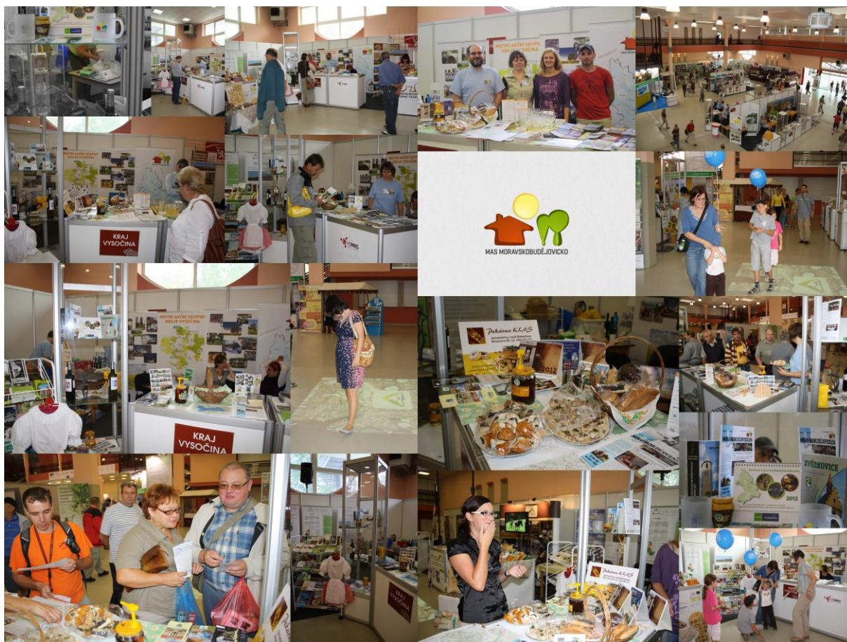
Obrázek 2: Země Živitelka 2012 - IECC, o.p.s.

Předcházíme jim individuálními konzultacemi se žadateli, kteří podepsali dohodu se SZIF – zejména ve fázi přípravy výběrového řízení a dále monitorujeme průběh realizace jednotlivých projektů.