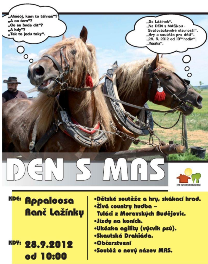
Obrázek 5: Pozvánka na DEN s MAS

Příprava na DEN s MAS 28.9.2012 – rozvoj letáků do obcí územní působnosti i mimo území MAS. Schůzky se starosty obcí i s neziskovým sektorem.