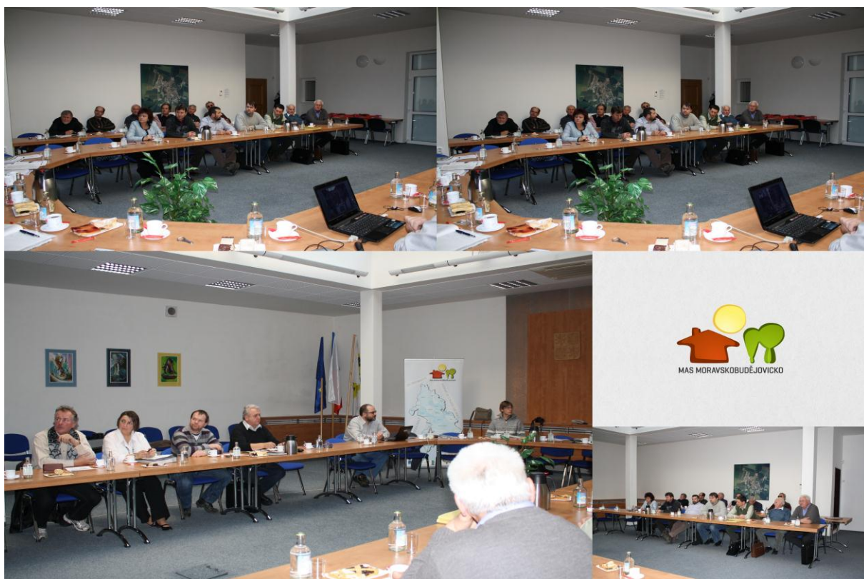
Obrázek 1: Setkání se Starosty - 9.11.2012

další (účast na výstavách apod.) účast na - Země Živitelka 2012