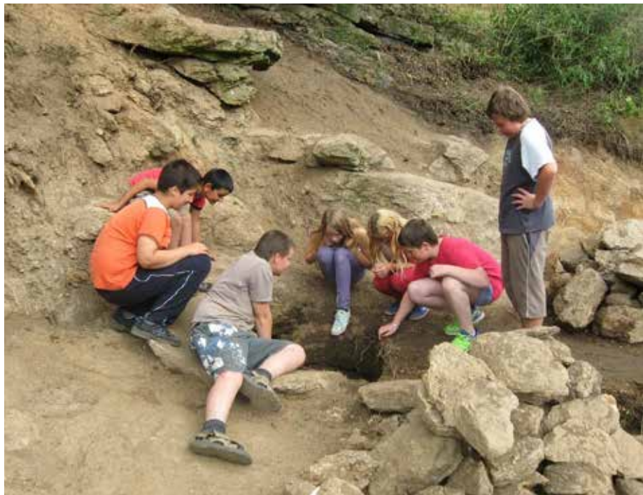
Děti u studánky v Příštěpě před rekonstrukcí