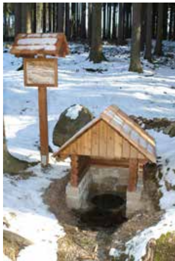
Čertova studánka – Lesonice