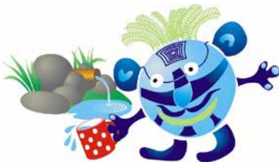
Vodomil - skřítek, který pečuje o studánky