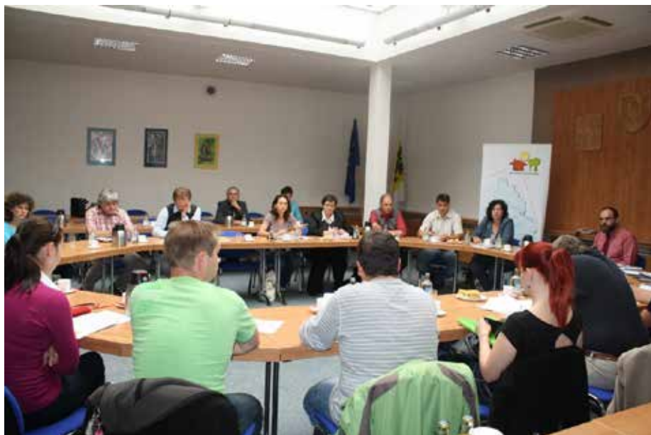
Veřejná obhajoba projektů

Tato fiche se zaměřovala na cestovní ruch a podobné aktivity, ale vzhledem k snížení celkové alokace na MAS byla z podpory vyřazena.